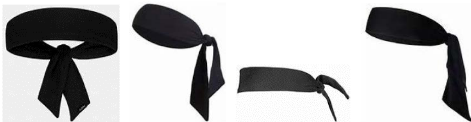
Obrázek 1 Příklady čelenek typu „kravata“

4 - 4 Ustanovení. Nošení čelenky typu „kravata“ není povoleno.