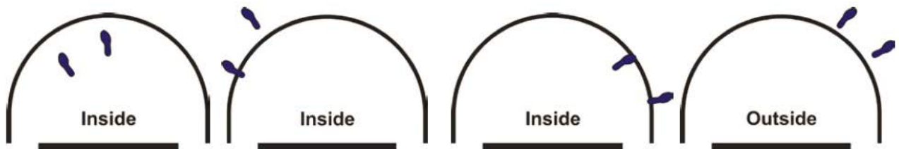
Obrázek 5 Postavení hráče uvnitř/vně území půlkruhu proti prorážení

33 - 4 Příklad: A1 začíná pokus o střelu z výskoku, který zahájí mimo území půlkruhu prorážení, a vrazí do B1, který je v kontaktu s půlkruhem proti prorážení.