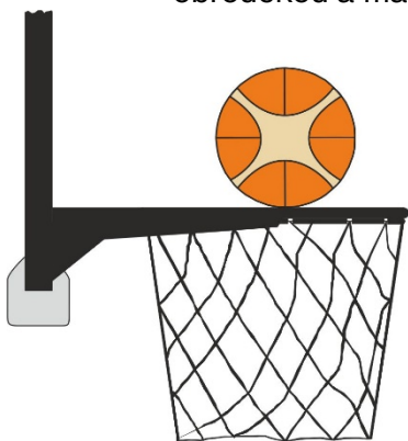
Obrázek 3 Míč je v kontaktu s obroučkou

31 - 18 Ustanovení. Srážení míče nastává, když se během střeley na koš z pole obránce nebo útočník dotkne desky nebo koše (obroučky nebo síťky), zatímco je míč v dotyku s obroučkou a má možnost padnout do koše.